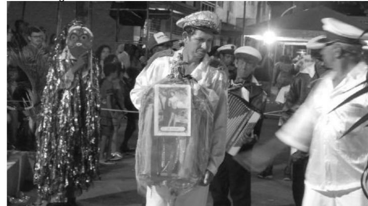
Folões se apresentam em festival realizado em Macuco