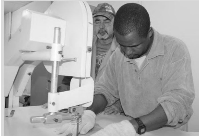
Cursos do Cevest são gratuitos

As inscrições para os cursos gratuitos do Centro de Formação do Vestuário (Cevest) em Nova Friburgo, serão abertas nesta quarta-feira (1º). As oportunidades são para aulas de costura íntima, artesanato, desenho de moda, modelagem fitness, modelagem íntima, aduaces, costura plana e de corte, costura e modelagem.