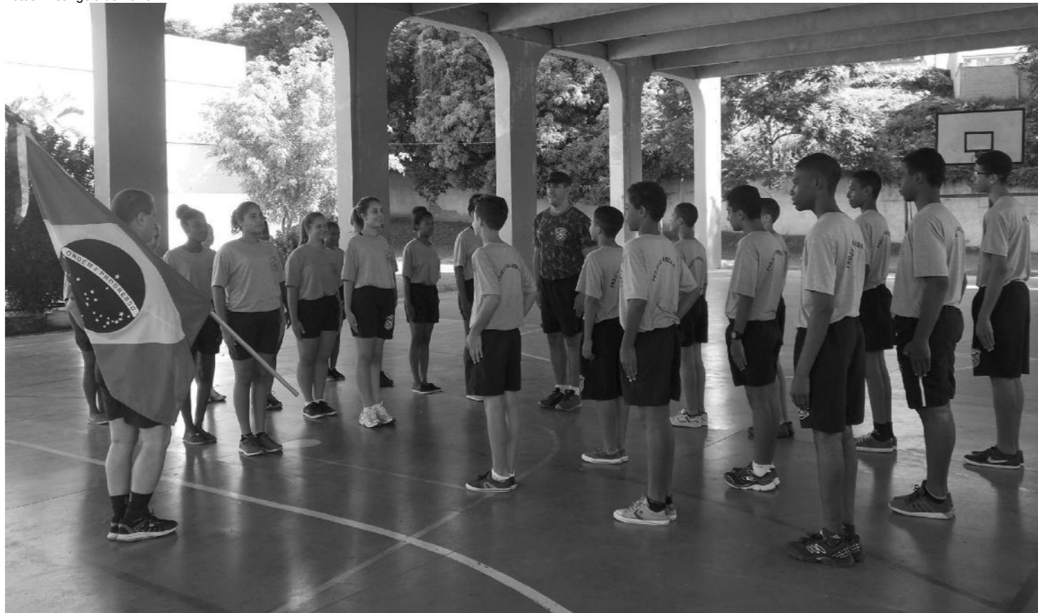
Turma 2017 durante ensaio para formatura.