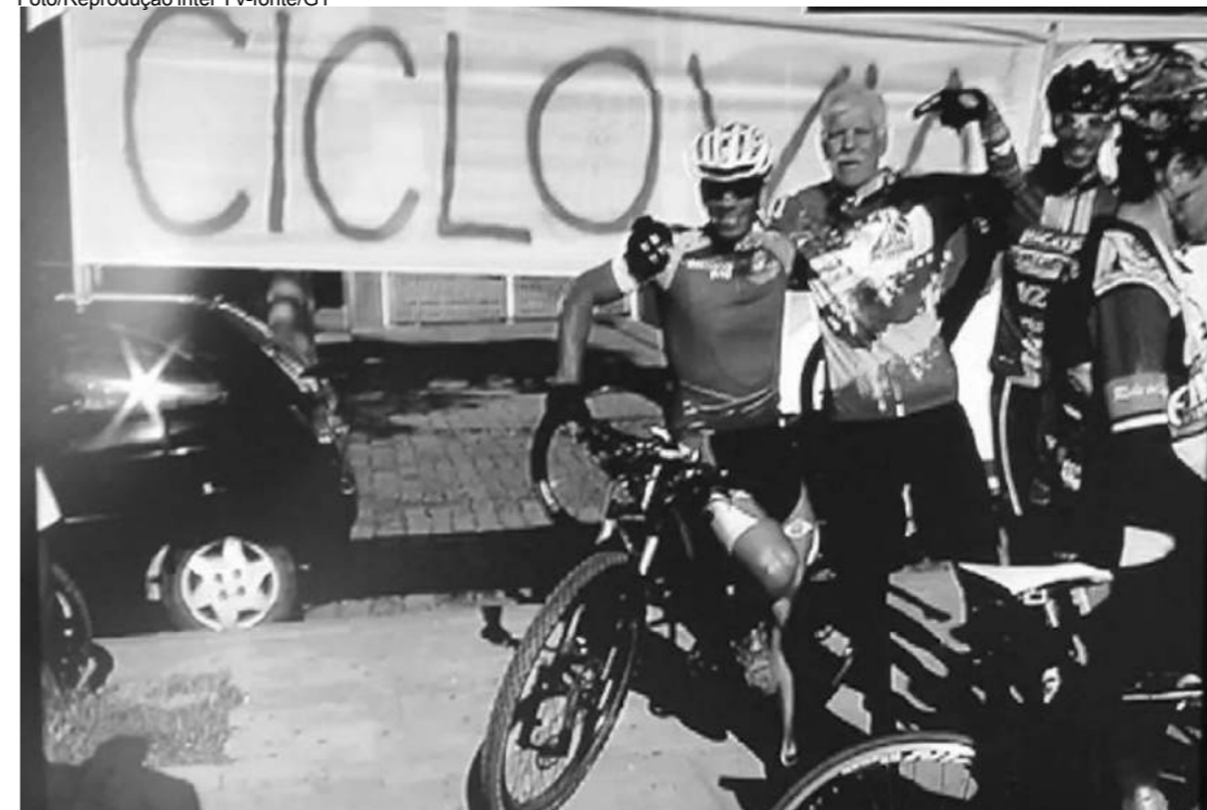
Grupos presentes no protesto usaram faixas e cartazes

balham em confecções e indústrias do setor metal mecânico vão para o trabalho de bicicleta. Algumas dessas empresas têm, inclusive, bicicletários.