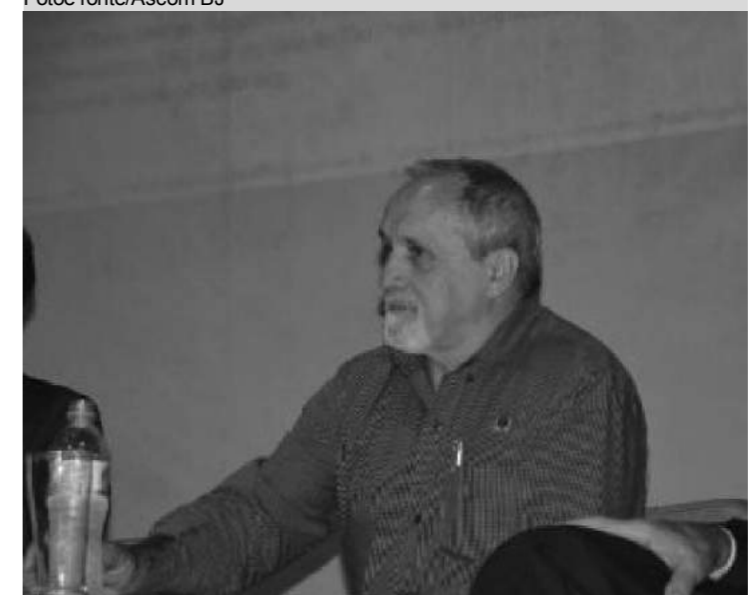
O prefeito Antonio Gonçalves